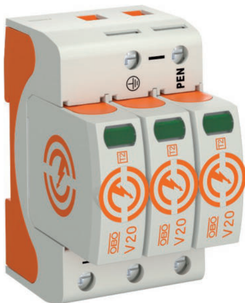
Überspannungsableiter Typ 2