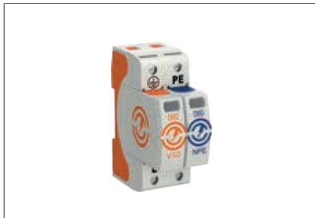
Blitzstrom- Kombiableiter Typ 1+2