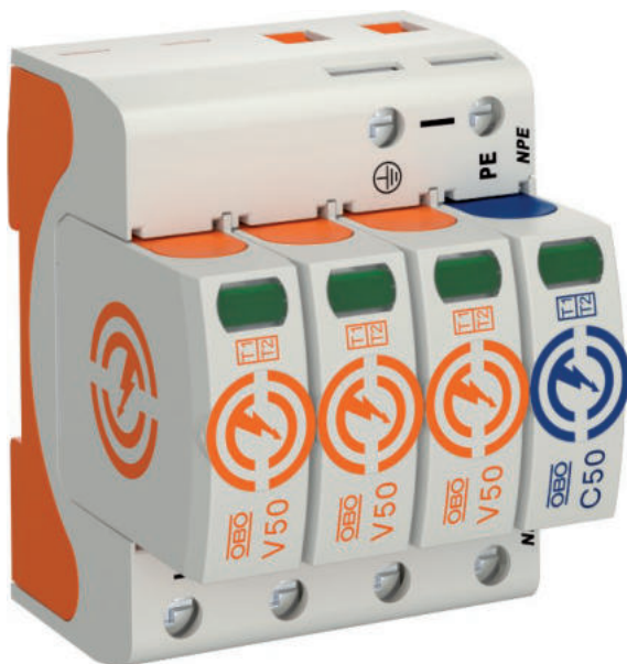
Blitzstrom-Kombiableiter Typ 1+2